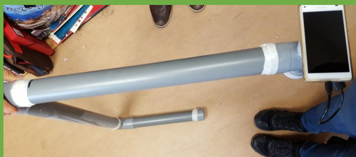
Réalisation d'un périscope inversé avec avancée en lien avec le groupe stop aux déchets en mer

Une action locale et citoyenne coordonnée par CAP vers la nature pour réduire les déchets qui s'accumulent en mer. Entre recherche-action citoyenne, éducation à l'environnement et diffusion de défis protecteurs des océans.